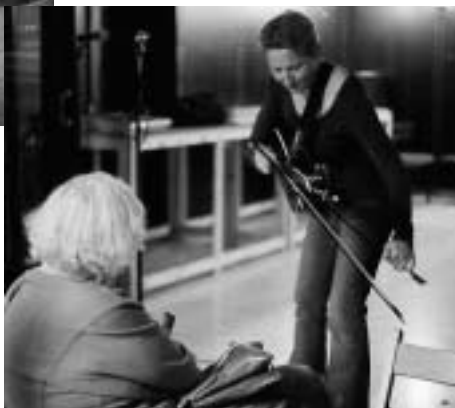
Předvánoční setkání klientů a dobrovolníků v divadle Komedie