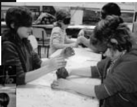
Interaktivní program pro děti ve Škole hrou