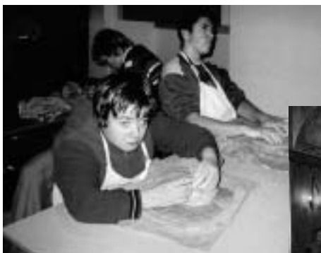
Arteterapeutická dílna v Jiřském klášteře