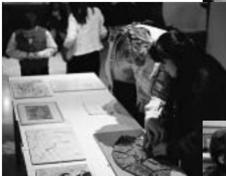
Vernisáž výtvarné výstavy "Navzájem" v Divadle Bez zábradlí