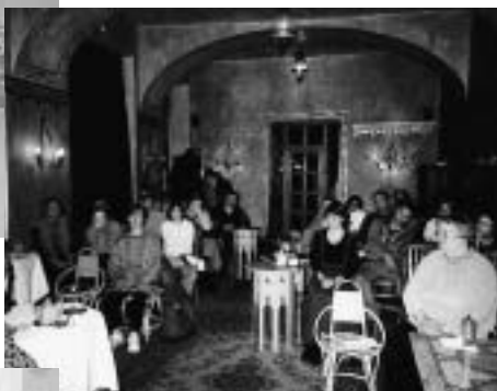
„Den s handicapem“ v Českém Krumlově