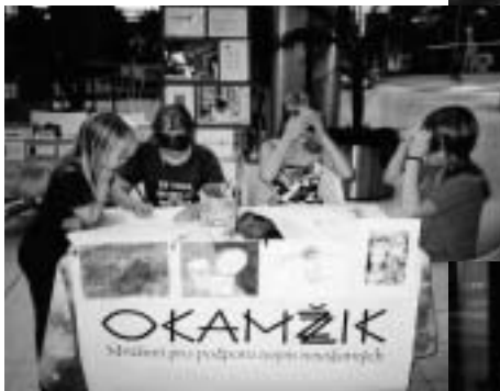
„Týden pro děti, mládež a rodinu“ v Tesco Praha - Letňany