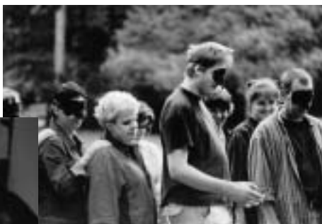
Setkání klientů a dobrovolníků Okamžiku ve Stromovce